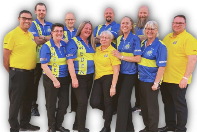
LANDSLAGET I EM 2022

På SM kan alla licensierade spelare delta utan kval. Sweden Cup är SM för lag och arrangeras av SvDF i samarbete med SDF ojämnta spelår, man tävlar med separata herrlag och damlag.